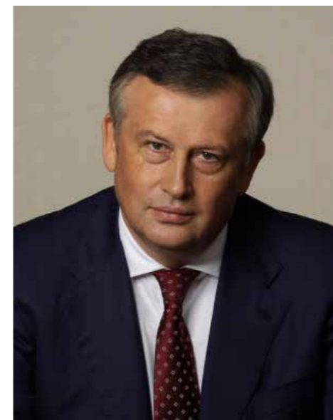
АЛЕКСАНДР ДРОЗДЕНКО, Губернатор Ленинградской области

АГРОРУСЬ вносит важный вклад в развитие индустрии продовольствия, привлекает новые «умные» инвестиции.