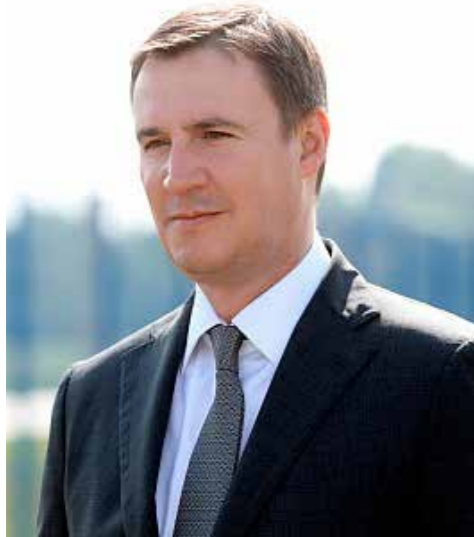
ДМИТРИЙ ПАТРУШЕВ, Министр сельского хозяйства Российской Федерации

За свою многолетнюю историю выставка АГРОРУСЬ стала значимым и ожидаемым событием для отрасли. На своей площадке она собирает главные достижения во многих сегментах российского АПК. Не только представляет лучшую продукцию перерабатывающих предприятий, производителей оборудования и сельхозтехники, ветеринарных препаратов и комбикормов, но и позволяет обсудить актуальные тенденции развития агропромышленного комплекса.